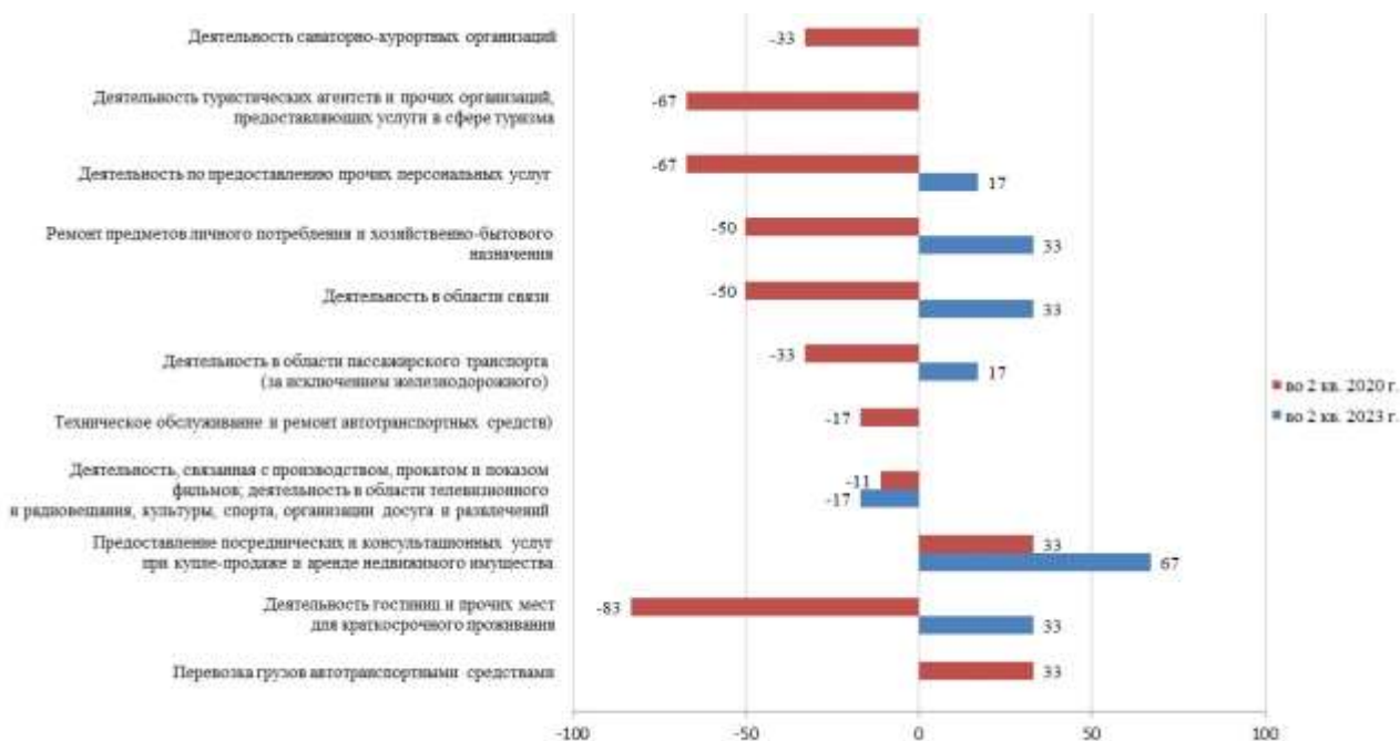
Рисунок 3. Индекс предпринимательской уверенности по видам экономической деятельности во 2 квартале 2020 и 2023 годов.

Напротив, во 2 квартале 2023 года, когда в анализируемом периоде отмечался рост предпринимательского настроения, руководители организаций, оказывавших гостиничные услуги, чувствовали себя более уверенно, о чем свидетельствует ИПУ по данному виду услуг, равнявший 33%. Однако, наиболее уверенно в этот период себя чувствовали руководителей организаций, оказывавших предоставление посреднических и консультационных услуг при купле-продаже и аренде недвижимого имущества, у которых ИПУ достиг 67%.