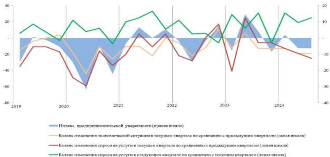
Рисунок 2. Индекс предпринимательской уверенности организаций сферы услуг в Республике Бурятия в 2019-2023 гг.

На основе балансов мнений руководителей, принимавших участие в обследовании в 2019-2023 гг., был рассчитан композитный индикатор – индекс предпринимательской уверенности (далее – ИПУ), который позволил оценить поведение руководителей в условиях текущей экономической ситуации в рассматриваемые годы (рисунок 2).